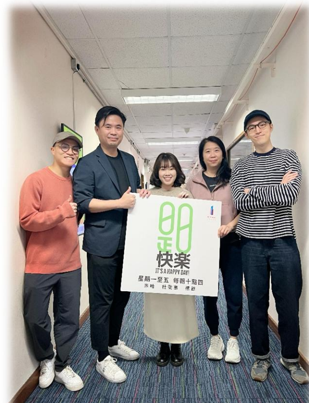
RTHK 快樂計劃：粵劇文化