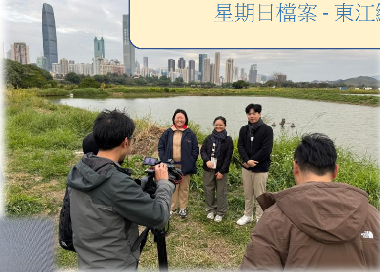
星期日檔案 - 東江縱隊