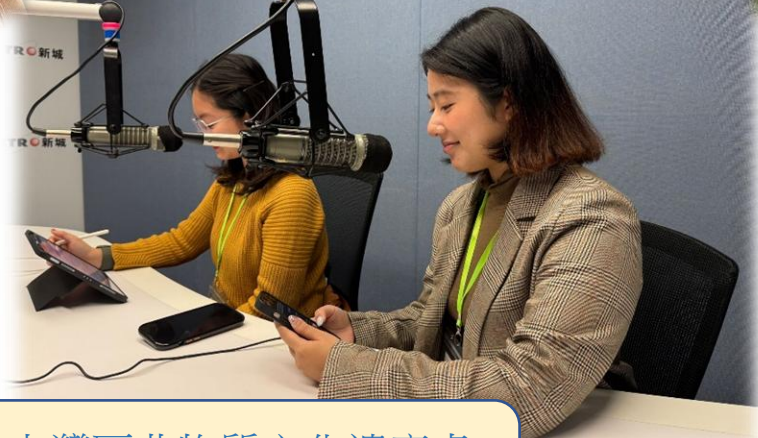
新城廣播 - 大灣區非物質文化遺產虛 擬博物館互動平臺開發先導計劃